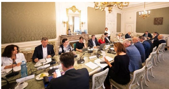
KULATÝ STŮL. Debata o příčinách nízké dostupnosti bydlení v Česku.