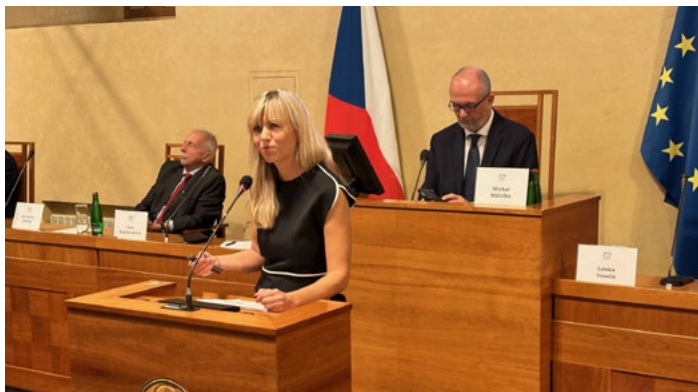
DNY NÁJEMNÍHO BYDLENÍ. Také letošní ročník konference proběhl v Senátu Parlamentu ČR.

Bydlení je základní lidská potřeba a jedním z cílů bytové politiky každé vlády by mělo být zajištění důstojného bydlení pro všechny – nikoli vlastnictví pro všechny. „Ne každý má možnost či potřebu vlastnit nemovitost. Víme, že cena nemovitostí roste, bude růst i nadále a vlastnické bydlení se stane pro mnoho lidí nedosažitelné. I to je důvod, proč stále více lidí volí a bude volit nájem jako svou preferovanou formu bydlení, a to zejména ve velkých městech,“ uvádí před-